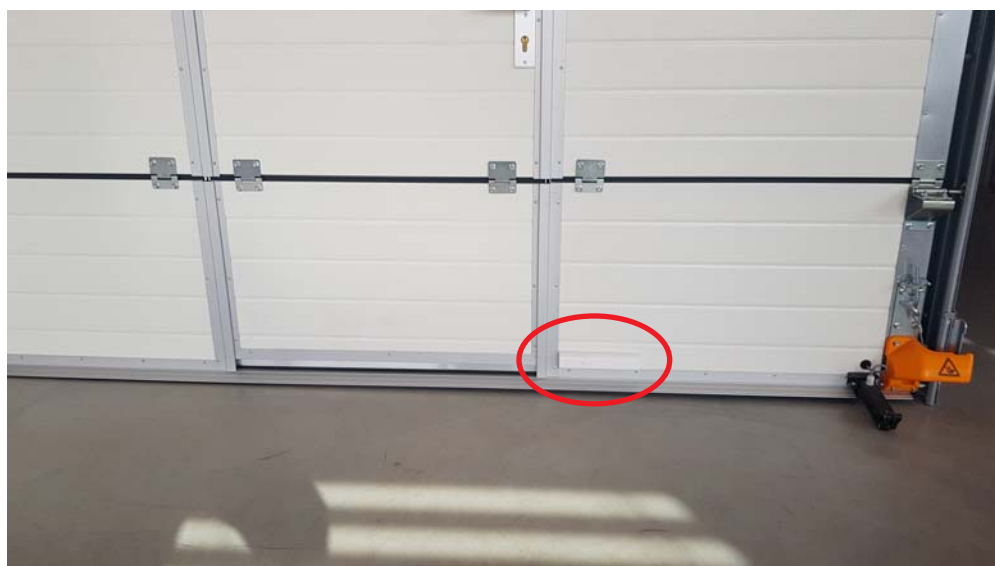
SD01/1 – nach der Instalation

Diese Sicherung wird vor allem bei Anwendungen von Deckenantrieben geeignet, weil für den Anschluss ist hier Spiralkabel nicht nötig und somit wird die Installation elektrischer Sicherung deutlich vereinfacht und beschleunigt.