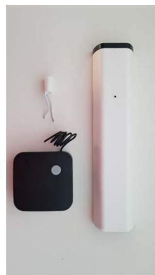
Set SD01/1 die Für Instalation