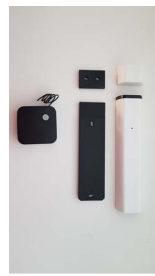
Set SD01/2 die Für Instalation