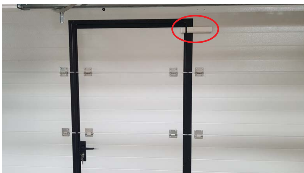
SD01/2– nach der Instalation